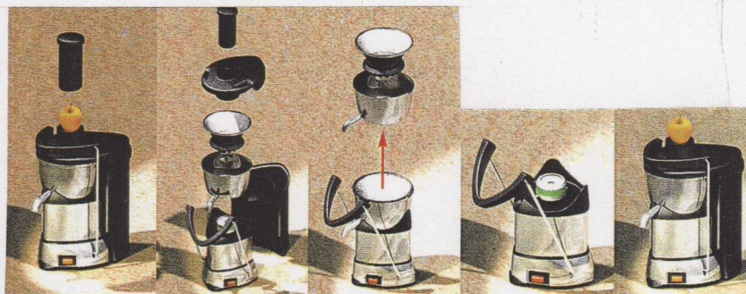
Centrifugen i bruk Isärplockad Locket avlyft Utan överdel Ihopplockad